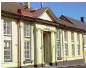
Siriushuset Stora Norregatan 20, 271 35 Ystad