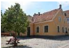
Föreningslokalen Lancasterskolan, Sankt Petri Kyrkplan 2, 271 34 Ystad